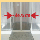
La porte d'entrée laisse un passage libre dont la largeur est inférieure à 75 cm

Autre: ..... Plan incliné: rampe d'accès amovible ou conçue "en dur", aménagée expressément pour des personnes à mobilité réduite, dans le but de "compenser" une différence de niveau sans devoir franchir de marches ou d'obstacles. Ne pas confondre avec une pente naturelle.