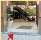
Il y a une toute petite marche à l'entrée (2-5 cm)