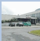
Il n'y a pas de place de parking réservée aux personnes handicapées