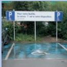
Il y a au moins une place de parking réservée aux personnes handicapées à proximité de l'entrée principale (max 25m), permettant l'ouverture des portières de deux côtés du véhicule (3m.30)