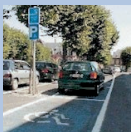
Il y a une place de parking réservée aux personnes handicapées éloignée de l'entrée principale