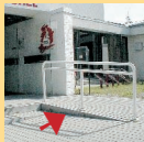
Il y a un plan incliné à l'entrée avec une pente douce, facile à gravir