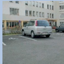
Il y a au moins une place de parking réservée aux personnes handicapées à proximité de l'entrée principale (max 25m), permettant d'ouvrir les portières d'un côté du véhicule (2m.20)