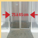
La porte d'entrée laisse un passage libre dont la largeur est comprise entre 75 et 85 cm de large