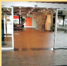
Il n'y a pas de marche à l'entrée

Autre: ..... Plan incliné: rampe d'accès amovible ou conçue "en dur", aménagée expressément pour des personnes à mobilité réduite, dans le but de "compenser" une différence de niveau sans devoir franchir de marches ou d'obstacles. Ne pas confondre avec une pente naturelle.