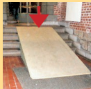
Il y a un plan incliné à l'entrée avec une pente forte, difficile à gravir