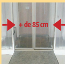
La porte d'entrée laisse un passage libre dont la largeur est de 85 cm ou plus