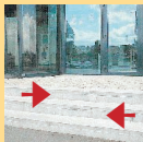
Il y a plusieurs marches à l'entrée (sans plan incliné)